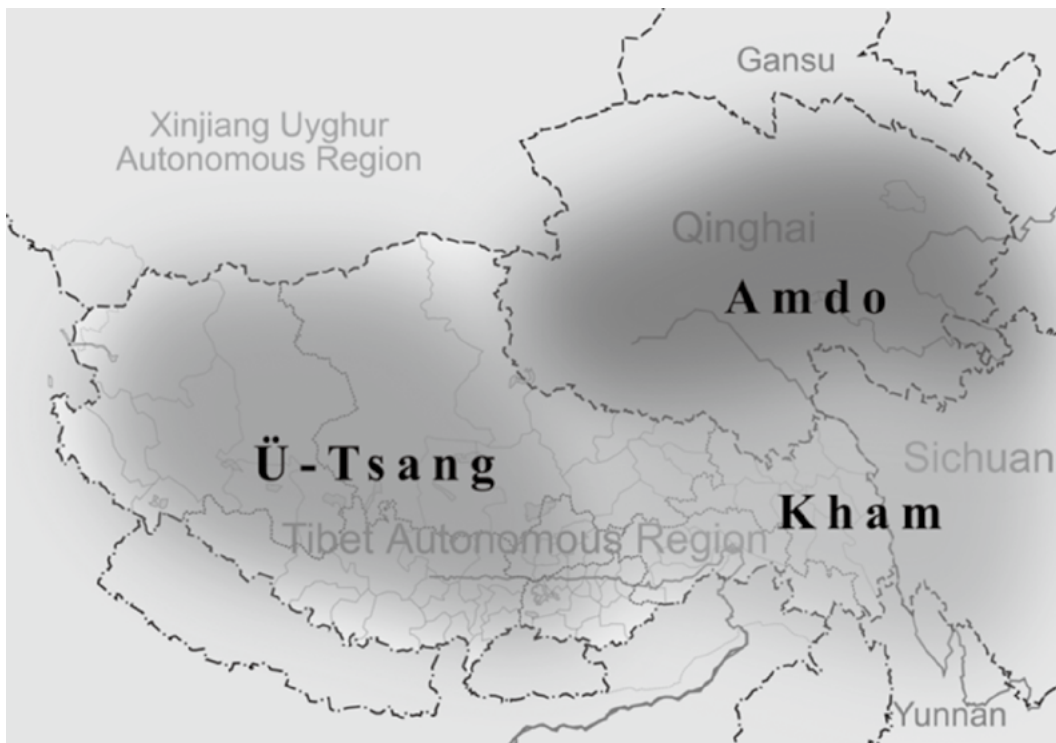
图一：藏区的传统划分：卫藏（左下）、安多（右上）、康巴（右下）

organized for the express purpose of carrying the Gospel to Tibet.) [7]