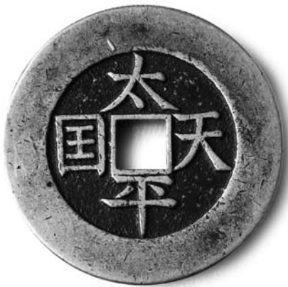
1853年，“拜上帝会”发展而成太平天国，一时间，西方世界以为中国将马上成为一个基督教的新国度。图为太平天国时期的铜币

在给妹妹的信中他写到：“假使我有千镑英金，中国可以全数支取。假使我有千条性命，决不留下一条不给中国。不，不是中国，乃是基督。”这句话后来成为他最常被引用的名言，激励了无数中西信徒。然而，极度劳累导致戴德生的健康急剧恶化，不得不回国休养。回到英国后，戴德生一面完成耽搁的学业，一面修订宁波语圣经，一面到处奔走，大力疾呼，希望能唤起英国教会对中国属灵需求的重