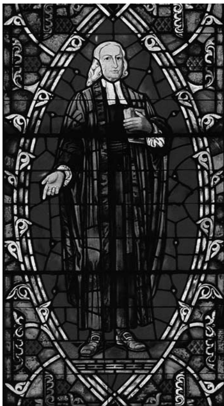
约翰·卫斯理（玻璃彩绘）

婚后两年，戴雅各夫妇生下一个儿子，取名戴约翰，从事纺织业。戴约翰17岁那年，戴雅各去世。年轻的戴约翰继承父志，也成为当地有名的带职传道人。他与妻子主办的主日学，左近村镇报名的孩子竟有六百名之多。孩子们入学不久，品行操守显著提高，使很多反对者开始参加教会，当年戴雅各所建的小礼拜堂已不敷使用，会众自发奉献，兴工建造了一座新教堂。