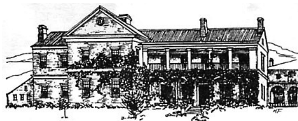
当年芝罘学校的女生宿舍

戴存仁是戴德生的长子，出生于戴德生首次回国养病期间。内地会成立那年，他四岁；搭乘兰茂密尔号首次踏上中国土地时，他五岁；扬州教案爆发时，他七岁；与弟妹一起被送回英国读书不久，便收到母亲去世的噩耗，那年，他刚满九岁，而父亲则常年不在身边。按照现代心理学的理论，在这样恶劣环境中长大的孩子，很难有什么出息。然而，戴存仁却是一个例外。十七岁的戴存仁被伦敦医院的医学院录用，刚完成两年基础课程，便收到父亲的来信——原来戴德生计划在山东烟台建立一所学校，以解决因团队不断壮大而面临的日益突出的需要：宣教士休养及子弟教育问题，这在当时又是一项创举。没有比戴存仁本人更